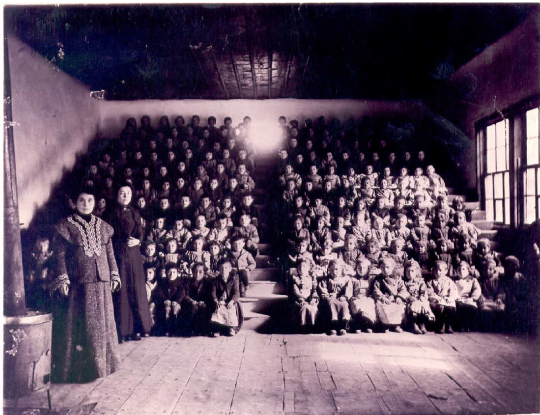
Νηπιαγωγείο Ραιδεστού, που ανήκε στο Παρθεναγωγείο της και λειτουργούσε από το 1854, 1900,

του. Ταυτόχρονα, επιχειρεί την ηθικοποίηση και την υποταγή του παιδιού, μέσα από χειρωνακτικές δραστηριότητες, και την υιοθέτηση ηθικών αξιών τέτοιων, που να εγγυώνται τη διατήρηση της υπάρχουσας κοινωνικής τάξης.