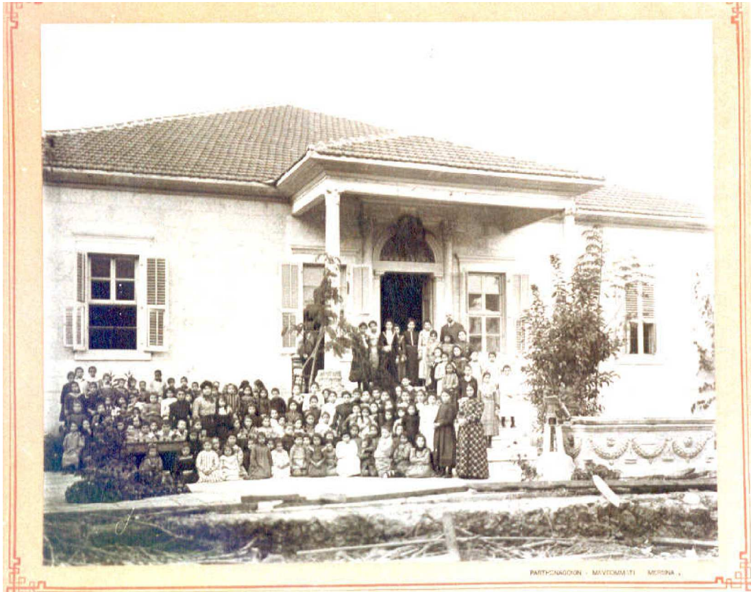
Παρθεναγωγείο, Μαυρομάτι Μερσίνας, 1990

Στο τέλος 19ου στην Ευρώπη, η ψυχολογία είναι η βασική θεωρητική συνιστώσα για τη δημιουργία της «επιστήμης της εκπαίδευσης» με εφαρμογή στην παιδαγωγική. Αυτή η τελευταία που εννοείται ως επιστήμη της εκπαίδευσης, ως μεθοδική μελέτη και ορθολογική έρευνα των σκοπών και των μέσων για την αγωγή των παιδιών. Η παιδαγωγική στοχάζεται τη δράση και όχι την εξήγηση και την αιτιολόγηση και δεν ενδιαφέρεται να συλλέξει εμπειρικά δεδομένα ούτε να παράγει επιστημονικές γνώσεις ώστε να ορθολογικοποιήσει τις διδακτικές πρακτικές.