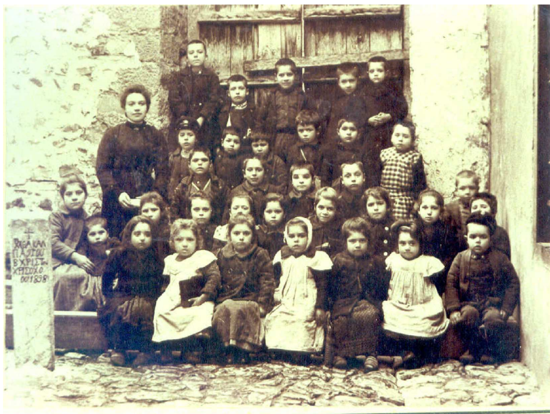
1 ο Τμήμα του εν Στενημάχω Νηπιαγωγείου του Τσιποχωρίου, 1903-04

Νόμος ΒΤΜΘ/1895 «Περί της στοιχειώδους ή δημοτικής εκπαίδευσεως» και Διάταγμα αρ. 68/1896 «Περί συστάσεως νηπιαγωγείων»: Αναγνωρίζεται ο θεσμός του νηπιαγωγείου, το δικαίωμα και οι προϋποθέσεις των ιδιωτών να συστήνουν νηπιαγωγεία, στα οποία να διδάσκουν πτυχιούχοι νηπιαγωγοί. Ορίζεται η ηλικία εισόδου σε αυτά και ο σκοπός της προσχολικής εκπαίδευσης: «σωματική και η πνευματική του παιδός επίρρωσις δια παιδιών, ασκήσεων και ευμεθόδου διδασκαλίας των στοιχείων των εφεξής εν τοις δημοτικαίς σχολαίς διδασθησομένων μαθημάτων». Τέλος, καθορίζεται η εφαρμοζόμενη παιδαγωγική και το ωρολόγιο πρόγραμμα.